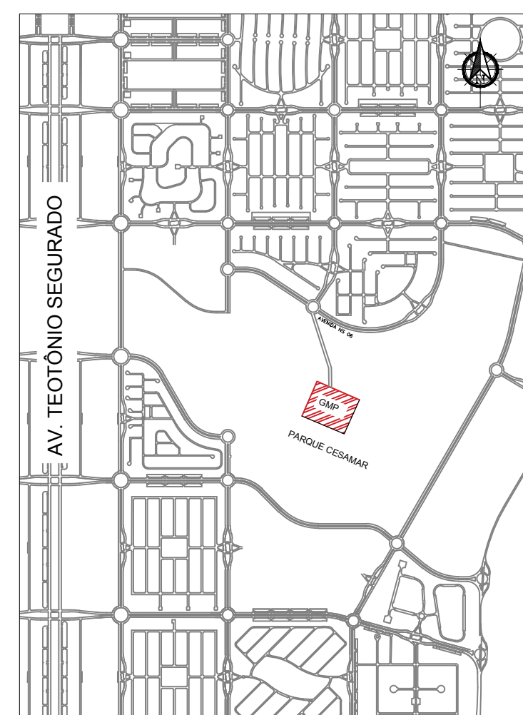
MAPA DE SITUAÇÃO SEM ESCALA