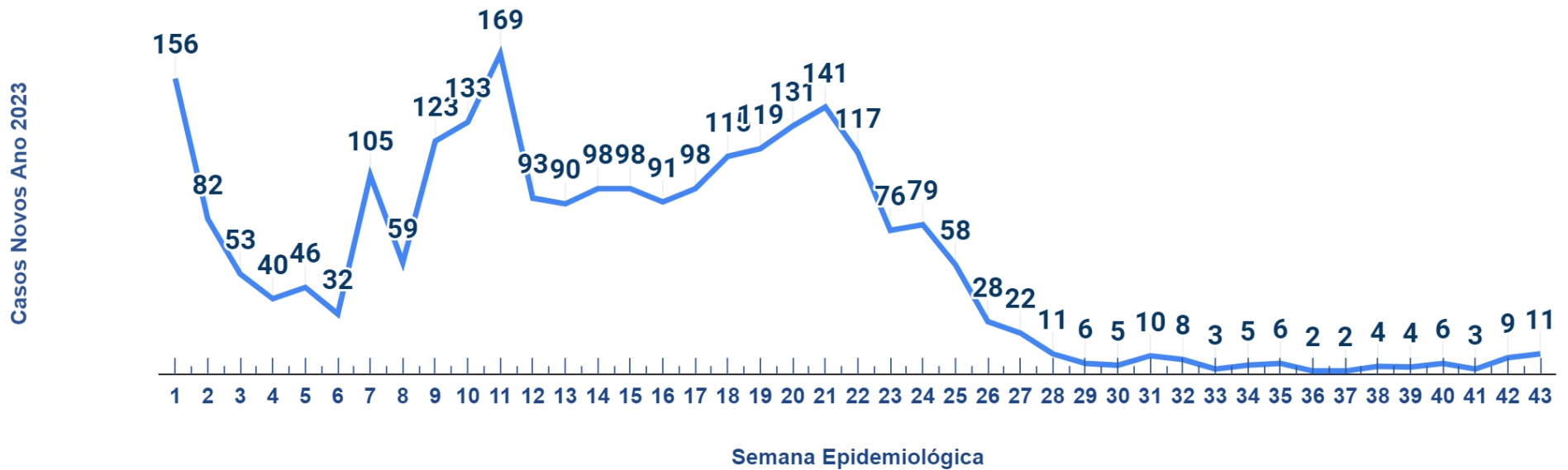
Gráfico 1. Número de casos confirmados para covid-19 por data de informação a Imuno Palmas e semana epidemiológica, em moradores de Palmas-TO, 2023.